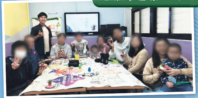
空氣草盆景工作坊