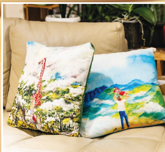
抱枕 (2款) 45 x 45cm