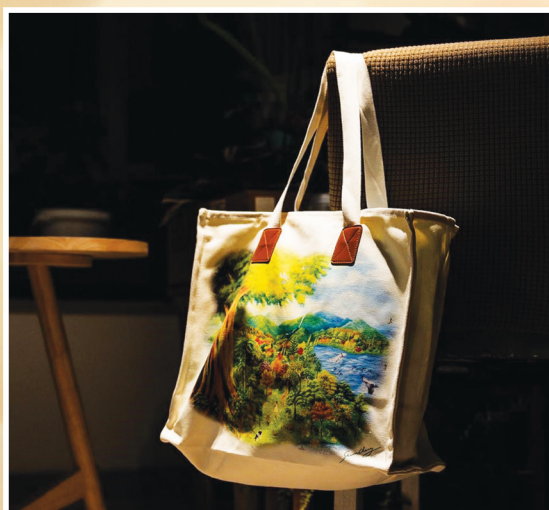
手提袋 45 x 40cm